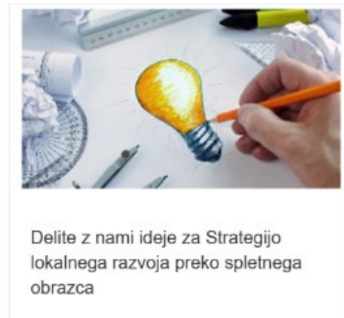
Slika 8: Objava na spletni strani LAS Barje z zaledjem