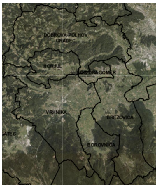
Slika 1: Občine, vključene v območje LAS Barje z zaledjem

Območje zajema jugozahodni del Ljubljanskega barja in okoliško hribovje s planotami ter dolinami, kot so Krimsko hribovje, Rakitniška planota, Pokojiška planota in Polhograjsko hribovje. Ljubljansko barje in izrazito hribovit del območja LAS sta redko poseljena, saj večina naselij leži na obrobju Ljubljanskega barja in na višje ležečih predelih hribovitega območja.