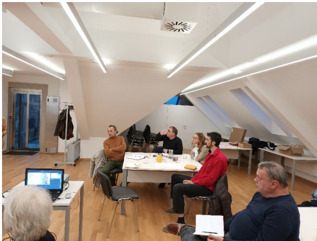
Slika 3: Prva delavnica – Podjetništvo (občina Log – Dragomer, dne 21.3.2023)

delavnice smo objavljali na spletni strani LAS Barje z zaledjem, Facebook profilu LAS, spletnih straneh vseh občin LAS Barje z zaledjem, pošiljali članom LAS in ostali zainteresirani javnosti. Izvedbo delavnice je spremljal lokalni medij (Naš časopis).