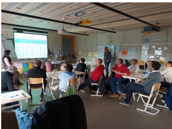
Slika 5: Tretja delavnica – Kmetijstvo (občina Borovnica, dne 4.4.2023)