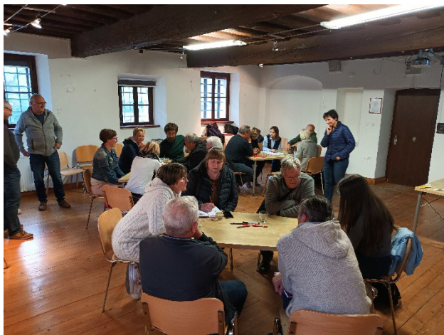
Slika 6: Četrta delavnica – Naravna in kulturna dediščina (Polhograjska graščina, dne 11.4.2023)