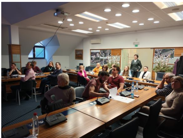
Slika 4: Druga delavnica – Mladi (občina Brezovica, dne 28.3.2023)